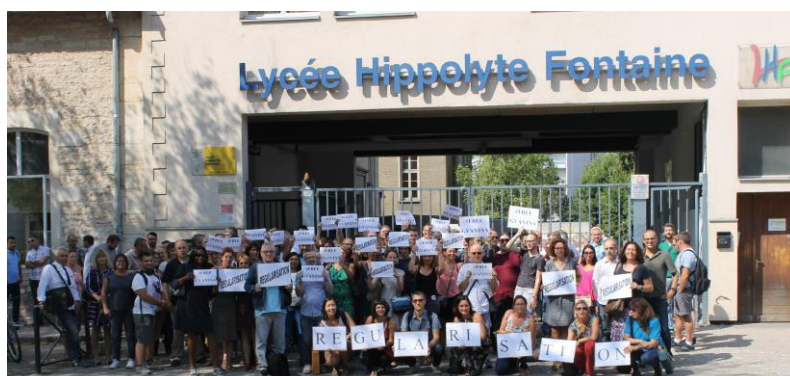
Soutien des professeurs du lycée H. Fontaine, ce vendredi 30 août lors de la rentrée scolaire.